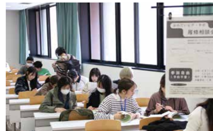
新入生対象履修相談会

関係学生団体「おのだいピアサポ」が学生の視点でピア・サポート活動を展開しています。