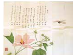
一枚摺・梅室秋興「夕かぜは」