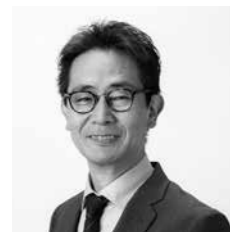
キャリアサポートセンター 講師

授業科目として、1年生向け「キャリア形成入門」と、2～4年生向け「キャリア形成演習」「ビジネスキャリア入門」を開講しています。「キャリア形成入門」では、卒業後の社会的自立に向けて、自分らしい生き方や働き方を考え、主体的に取り組む姿勢を身につけます。「キャリア形成演習」では、実際の企業・団体での経営課題にチームで取り組み、プレゼンテーション資料を作成し発表することで、就業力や社会人基礎力を身につけます。「ビジネスキャリア入門」では、学生が社会や職業に対する理解を深めることを目的として、企業研究をはじめとする実践的なグループワークと、外部講師による働き方に関する講話を通じた学びを提供します。これにより、職業観や就業意識の形成を促し、将来の職業選択に資する基盤を築くことを目指します。