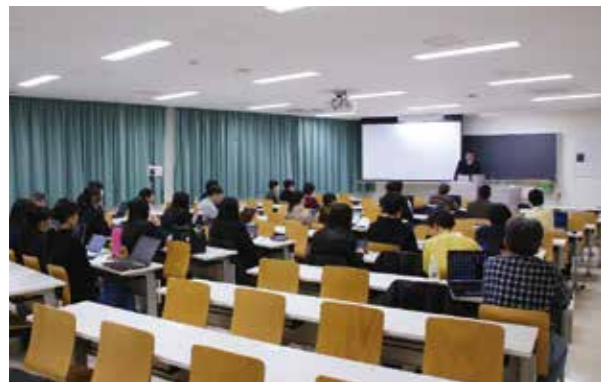
第36回 情報科学研究会 (2024年度)

また、進化し続ける情報社会に対応したセンターを目指しており、地域貢献と研究活動の推進などを目的として、コンピュータ公開講座や情報科学研究会なども開催しています。