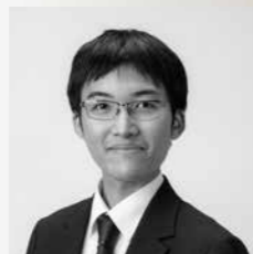
尾道市立大学附属図書館