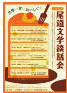
尾道文学談話会 広報物