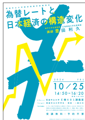
経済情報学部公開講演会 広報物