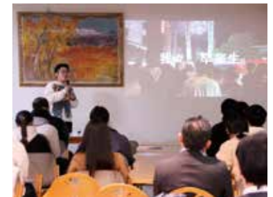
卒業予定留学生による報告会 及び地域の方々との交流会