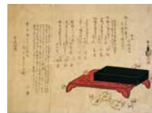
一枚摺・三石七回忌追善「梅にわれ」