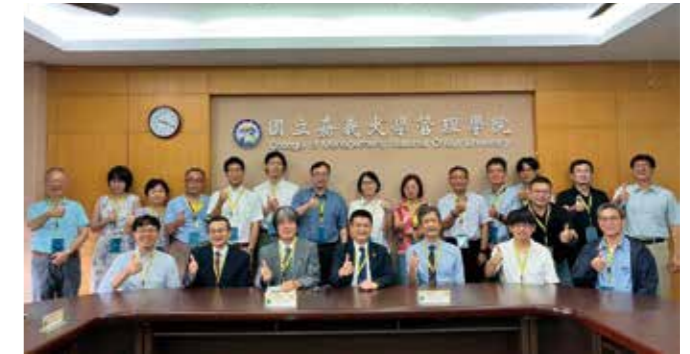
台湾 国立嘉義大学との合同カンファレンス