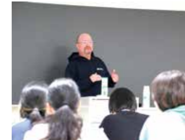
国際交流センター講演会