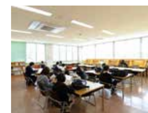
美術閲覧室 (マンガコーナーが設置されています)