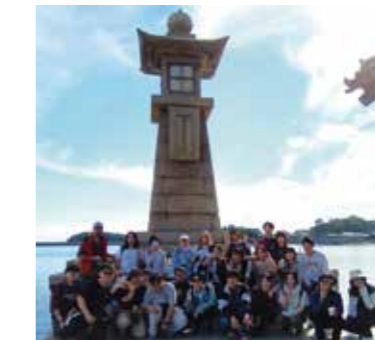
One day trip (国際交流のための1日研修)