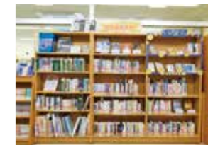
尾道関連資料コーナー