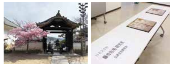
探訪地でのひととき