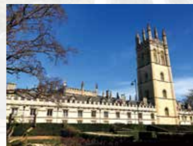
オックスフォード大学、モードリン・カレッジ (右側の棟が特徴的)

では、文構造や談話構造、更には英語と日本語の事態に対する認知方法の違いにも留意して解釈をする練習を繰り返します。これにより、辞書と読解方略を組み合わせることで英文を正しく読み、授業後も自己学習を進められる力を身につけることを目指します。