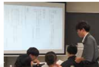
国語科教育法Ⅱでの模擬授業風景