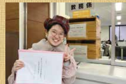
中世ゼミ生卒業論文提出の一コマ

ゼミ生一人一人が意 欲をもち、主体的に 研究を進める姿勢が 大切になってくるゼ ミです。