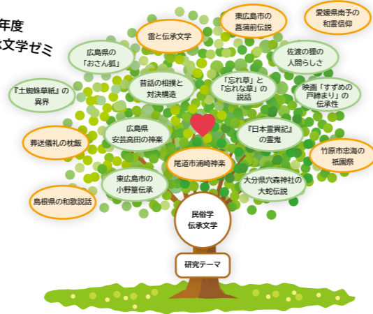
2025年度 民俗学・伝承文学ゼミ

隣接領域である文学と民俗学に注目しながら、日本の伝承、文化を研究しています。個人的には、学侶が唱導に用いた昔話や伝説などの口伝世界を研究対象とし、地域の文化調査も進めています。まったく別世界に思われる分野が自然に結びついたとき、日本文化の奥深さを実感すると同時に伝承の世界が少しずつ身近になります。ゼミには好奇心旺盛な学生たちが集まり、バラエティに富む調査・研究を楽しんでいます。