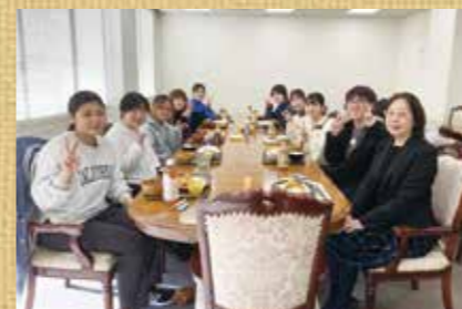
ゼミ生との食事会

ふわふわと柔らかな 雰囲気です。話し やすい人ばかりで、 研究の話も日常の話 も盛り上がります。