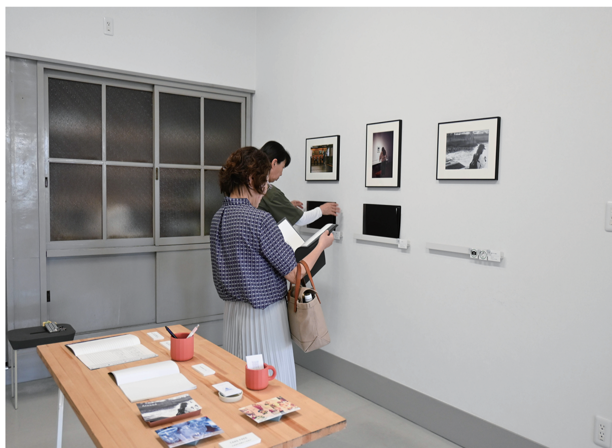
写真を楽しそうに見てくださった尾道在住の方